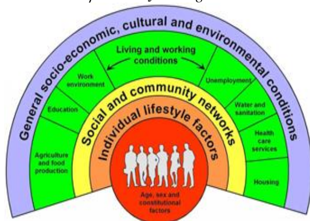
Εικόνα 1. Ουράνιο Τόξο Dahlgren-Whitehead